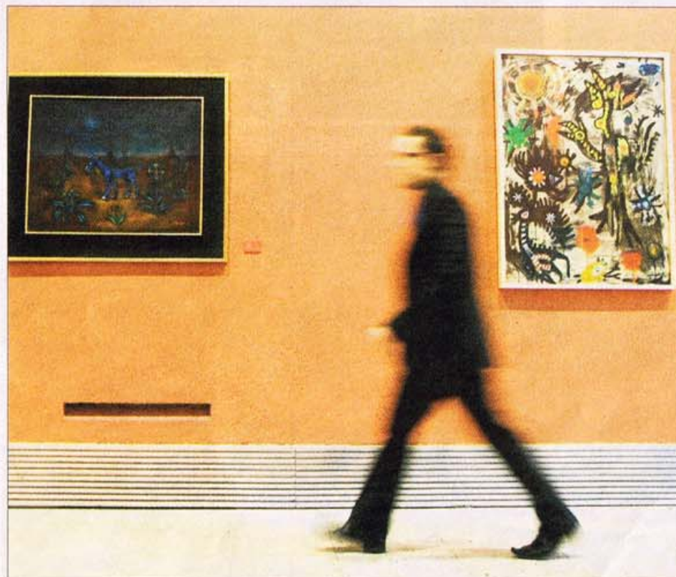
Al fondo dos obras de Joan Ponç, desde ayer en la sala de exposiciones de la Pasión.

catán muy representativo de la posguerra, enmarcado en el expresionismo pictórico hasta llegar al arte informal. Joan Ponç (1927-1984), del neohiperrrealismo, se caracteriza por las imágenes fantasmagóricas, fiel reflejo de su visión del arte como una introducción a los misterios que encierra el espíritu. Antoni Tàpies (1923) es un pintor, escultor, teórico del arte y uno de los más destacados exponentes del informalismo en todo el mundo. Brossa (1919-1998) participó en la Guerra Civil en el bando republicano y en plena contienda comenzó a escribir. Tharrats (1918-2001) muestra gran influencia de Mondrian y Kandinsky, el sociólogo y crítico de arte Puig i Grau (1926) fue uno de los principales impulsores del vanguardismo en Cataluña y el poeta y crítico Cirlot (1916-1973), estuvo muy relacionado con André Breton.