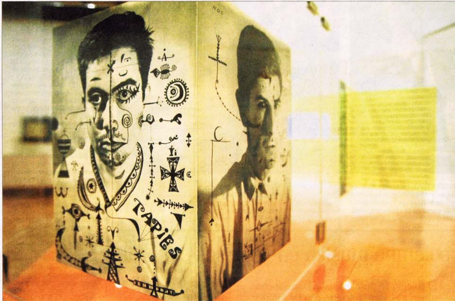
Imagen de Tàpies en la revista Dau al Set , hasta el próximo día 11 de enero en el sala de La Pasión.

EXPOSICIÓN / La sala municipal acoge por primera vez en España hasta el día 11 de enero la obra de Brossa, Arnau Puig, Joan Ponç, Tàpies, Modest Cuixart, Tharrats y Cirlot en el 60 aniversario del grupo y la revista